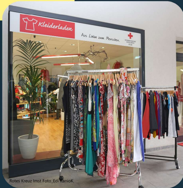
Rotes Kreuz Imst

Gib ' Kleidung eine zweite Chance! In dieser Stunde erfährst du Wissenswertes über die Arbeit im Kleiderladen auf der Ötztaler-Höhe und wie Ehrenamtliche dort zum Einsatz kommen.