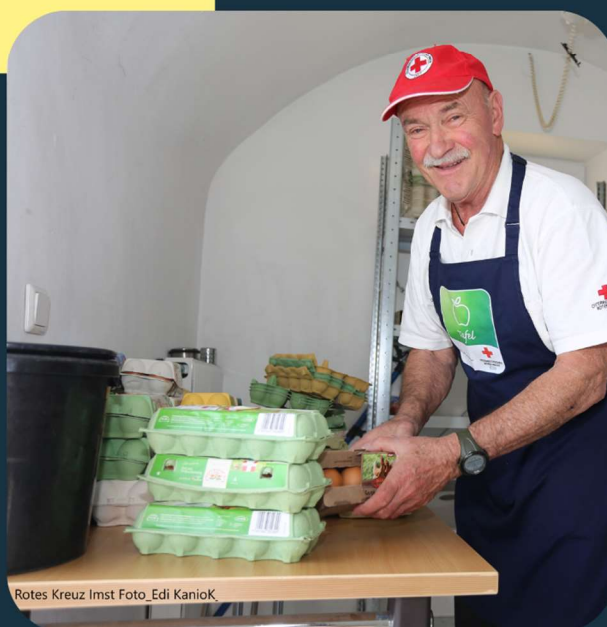
Rotes Kreuz Imst

In dieser Stunde erfährst du Wissenswertes über die Arbeit bei der Tafel des Roten Kreuz in Imst und wie Ehrenamtliche dort zum Einsatz kommen.