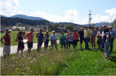
Exkursion nach Kirchbichl.

Ein paar Monate sind seit der letzten Ausgabe von Regiotell vergangen. Monate in dem das Team von Regio Imst neben vier neuen LEADER-Projekten auch den Besuch einer polnischen LEADER-Delegation und einer Exkursion nach Kirchbichl zur naturnahen öffentlichen Grünflächengestaltung durchführen durfte. Darüber hinaus stellte auch die neue Datenschutzgrundverordnung das Team vor neue, aber lösbare Herausforderungen.