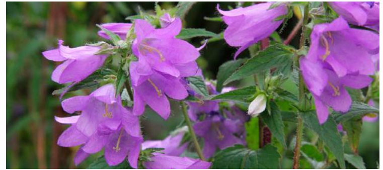
Die Nesselblättrige Glockenblume lockt viele nützliche Insekten an und schafft so Biodiversität.

res sehen die Schäden vor unserer Haustür, wir müssen auf den Klimawandel reagieren, sonst werden wir unseren Kindern kein schönes Erbe hinterlassen“, so Schatz.