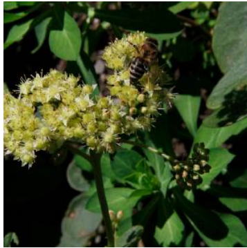
Die Waldfetthenne ist eine anspruchslose Pflanze.

Die Waldfetthenne ist eine überaus anspruchslose Pflanze. Sie bevorzugt einen mageren Boden in der Sonne oder im Halbschatten. Düngen und pflegen muss man die Pflanze nicht. Lediglich im Frühling soll man sie zurückschneiden – so wie die meisten Blütenstauden im Garten! Schneidet man die Blütenstauden im Herbst nicht zurück, können sich hier Insekten und ande-