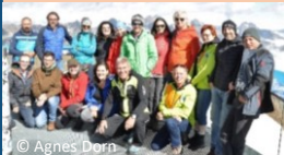
Vernetzungstreffen KEM Imst am Pitztaler Gletscher Sommer 2021

Bis Mitte März steht die Gemeindepolitik im Zeichen der Wahlen. Danach dürfen wir wieder daran gehen, unsere Region positiv, mit frischer Motivation mitzugestalten. Sicherlich gibt es schon Ideen und Projekte. Deshalb: Bitte ein Energieteam oder einen Umweltausschuss als Ansprechpartner,