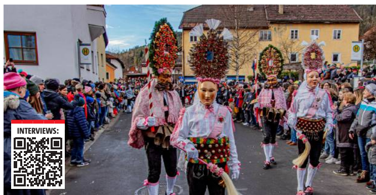
Die Imster Fasnacht steht im Mittelpunkt eines Videos, das von rund 37 Zeitzeugen im Interview begleitet wird.

Dazu werden Porträts der „Zeitzeugen der Imster Fasnacht“ per Video erstellt, die im Fasnachtshaus sowohl bei speziellen Veranstaltungen einem interessierten Publikum gezeigt werden und auch die permanente Ausstellung ergänzen sollen. Einen kleinen Vorgeschmack auf die Interviewporträts lieferte ein drei-