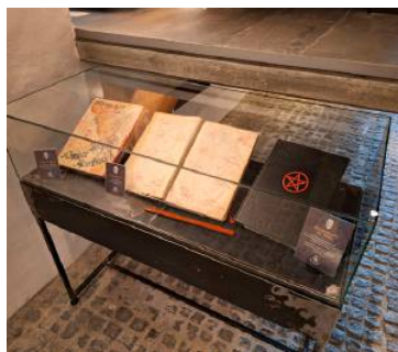
In der Glasvitrine gut gesichert: Die Hexenbücher.