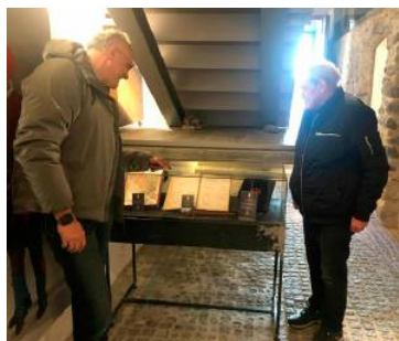
Groß ist das Interesse an den Imster Hexenbüchern.

interviewt, mit teils großartigen, emotionalen, berührenden, aber auch humorigen Sequenzen! Nach umfangreichen Archivierungs- und Filmschneidearbeiten werden ab Februar 2025 die ersten Interviewporträts auch im Internet unter www.fasnacht.at oder https://tv.fasnacht.at/home/ zugänglich sein.