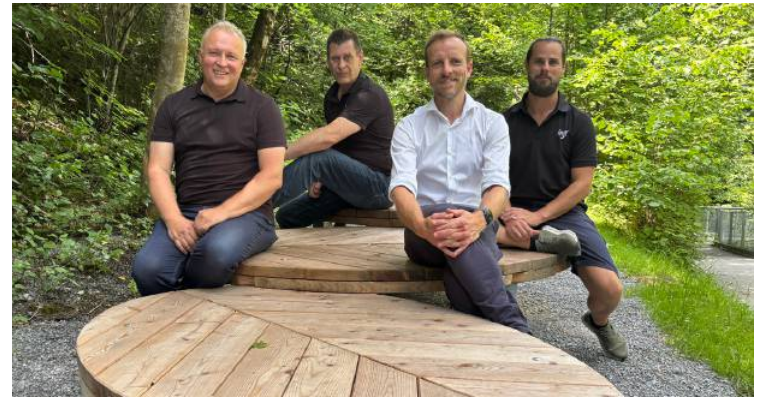
Auch Plätze zum Verweilen wurden geschaffen, wie hier im Steffwald, der mit einigen Stationen ausgestattet wurde.