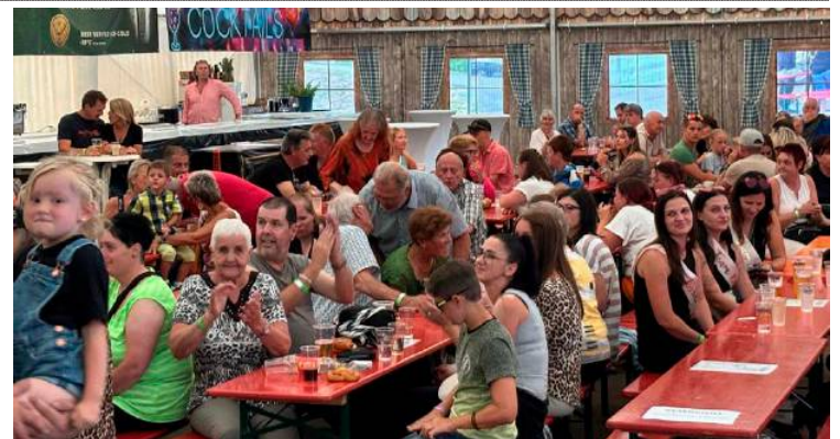
Die Driving Village verwandelte sich am Wochenende in eine Party-Location der besonderen Art.