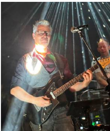
Mit Bergalarm war eine echte Topband im Einsatz.

Samstag stürmten die Partytigger das Festgelände und wurden dabei von Topacts unterhalten. Von „Bergalarm“ über „Wildbach“, „Bergblitz“ und dem Jugendblasorchester Tarrenz blieb kein Auge trocken. Djane Daniela Alfinito sorgte für den finalen Höhepunkt. Am 11. Juli 2026 wird die dritte Auflage des Gurgltaler Vereinsfestes stattfinden.