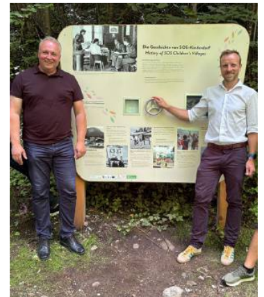
Auch „interaktive“ Stationen finden sich im Themenweg.

ist SOS-Kinderdorf in mehr als 130 Ländern aktiv. Damit diese Geschichte sichtbar wird und gleichzeitig der Blick in die Zukunft geöffnet wird, wurde ein neuer Themenweg gestaltet. Er führt als Spaziergang durch Wald und Natur rund um Imst. Elf Stationen laden dazu ein, innezuhalten, sich zu erinnern und Neues zu entdecken.